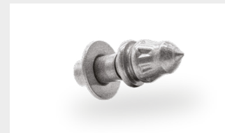
コンクリート表面での作業用ツース