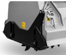
調整型右スキッド 重複におけるヘッドアライメントを矯正

セルフレベルリング装置搭載アタッチメントプレート 操作中でも正確なヘッドアライメントが可能