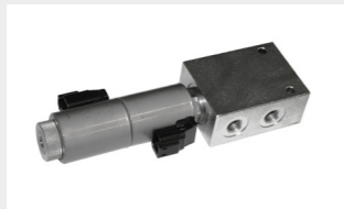
ディバーターバルブ 深さを制御