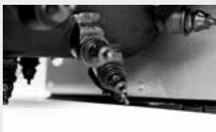
用于混凝土作业的水泥刀头