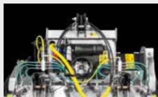
标准 WSS 喷水系统 减少灰尘并冷却刀齿