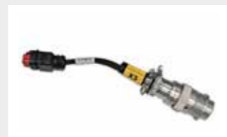
连接线 连接线接口允许即插即用连接到市面上多数的滑移装载机