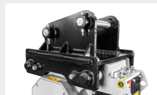
カスタマイズ型 アタッチメントブラケット