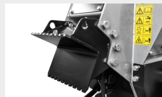
フロント固定サム